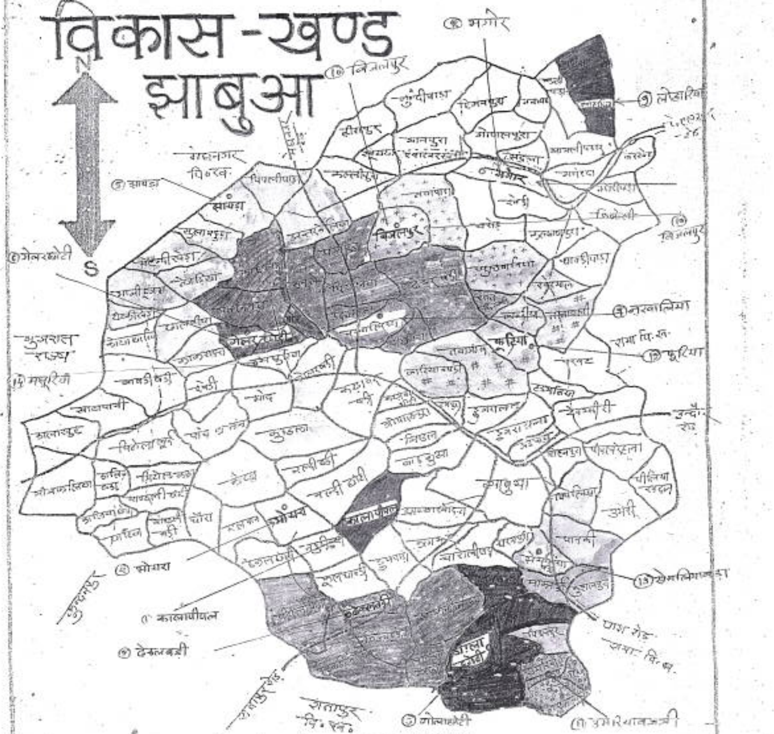
केन्द्र के नाम व मूगतान के दिक्क